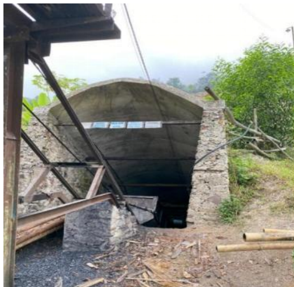
Gambar 3. Penyangga Beton Bertulang CV BMK

Pada beberapa zona persimpangan lorong utama ( junction ) yang memiliki bentang bukaan lebih lebar dan memikul konsentrasi tegangan ganda, diaplikasikan sistem penyanggaan komposit berupa kombinasi tiang kolom beton bertulang ( reinforced concrete