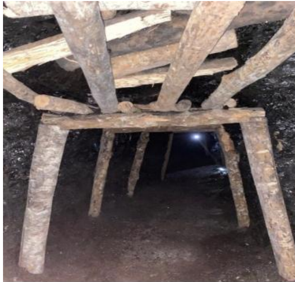
Gambar 2. Penyangga Kayu Three Pieces Set CV. BMK