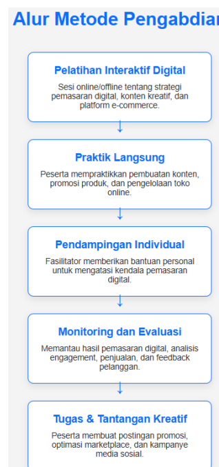
Gambar 1. Alur Metode Pengabdian Pemasaran Digital UMKM